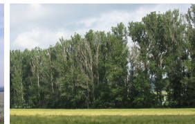
Struktur weitgehend vital, erste Pappeln absterbend