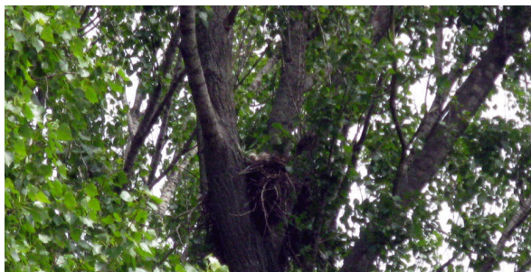
Rotmilanhorst mit Jungtieren bei Nienhagen

Es besteht akuter Handlungsbedarf zur Erhaltung des Rotmilanbestandes in der Region!