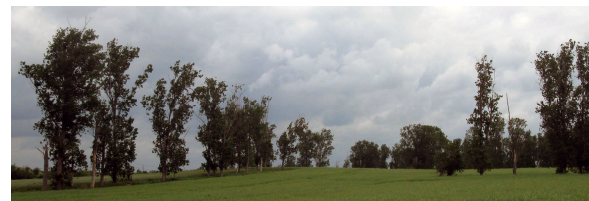
Ca. 60-jährige Struktur, nur noch in Resten vorhanden