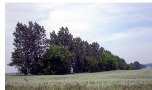
Junge, etwa 30-jährige Struktur mit Eschen-Ahorn

Das Projektgebiet (etwa 565 km 2 ) beinhaltet die typische Agrarlandschaft des Nordharzvorlandes mit Teilen der Bode-Selke-Aue, des Großen Bruchs sowie des Helsingers Bruch.